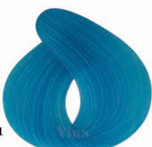
AP1 Python blue (Bermes) پیتون آبی (برمس)