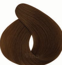
AF11 Royal Chocolate شکلاتی رویال