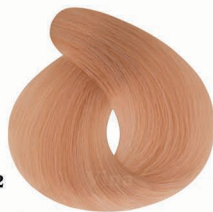
AF2 Flural Blonde بلوند فلورال