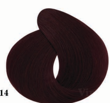
AF14 Roseberry تمشکی (دازبری)