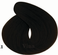
AF1 Wood Charcoal ذغال چوبی