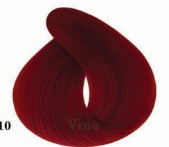
AF10 Carmine قرمز کارمین