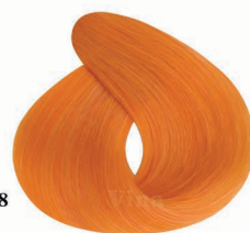
AF8 Aurora شفق قطبی