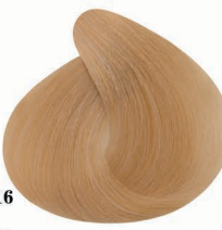
AF16 Bony استخوانی (بونی)