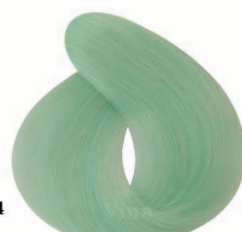
AP4 Python Green (Calpour) پیتون سبز (کالیپوری)