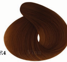
AF4 t برنز اورچل