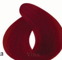
AP3 Python Red (Dehlizi) پیتون قرمز (دهلیزی)