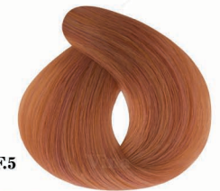
AF5 Red Wood چوبی (رد وود)