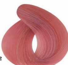
AP2 Python Pink (Armanet) پیتون صورتی (آرمانت)