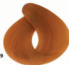
AF9 Salmon نارنجی سالمون