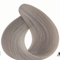
AF12 Topaz Silver نقره ای توپاز