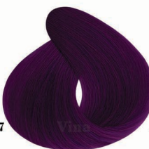
AF7 Fojia Violet بفش فوجیا