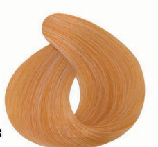
AF13 Golden Mrosa طلایی مروسا