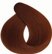
AF6 Lava کدازه های لاوا (مسی)