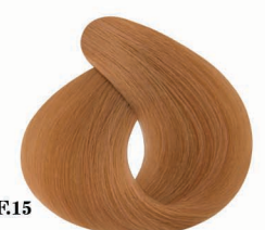
AF15 Matches کبریتی